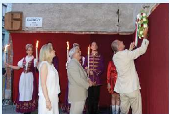
koszortítások a Kazinczy utcai táblánál 2014.