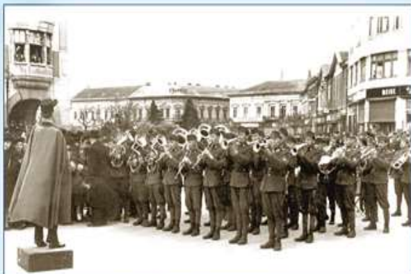
1941 Dugonics téri hangverseny