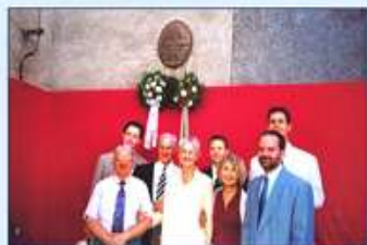
A Fricsay család és Szeged város vendéglátói koszorúznak 2004.

a Fricsay Ferenc Emléktáblához a koszorúzó menet.