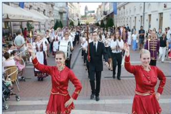
menetzene a Kárász utcán