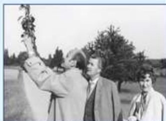
Simándy Józseffel Németországban 1962.

Megcsodáltuk milyen kitartással épített egy nem várt zenekari kultúrát fel egy vidéki városban, mint Szeged.”