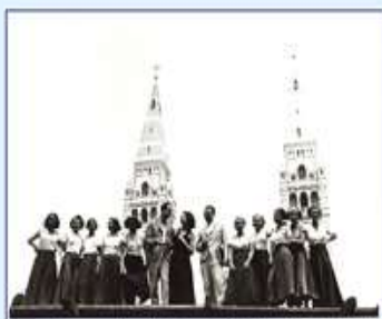
Fricsay Ferenc táncosokkal a Szegedi Szabadtéri Játékokon 1934.