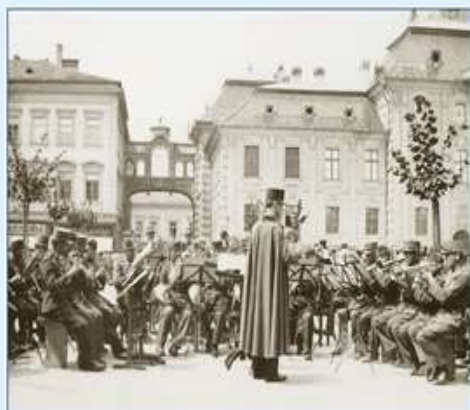
Fricsay a városháza előtt vezényel 1937.